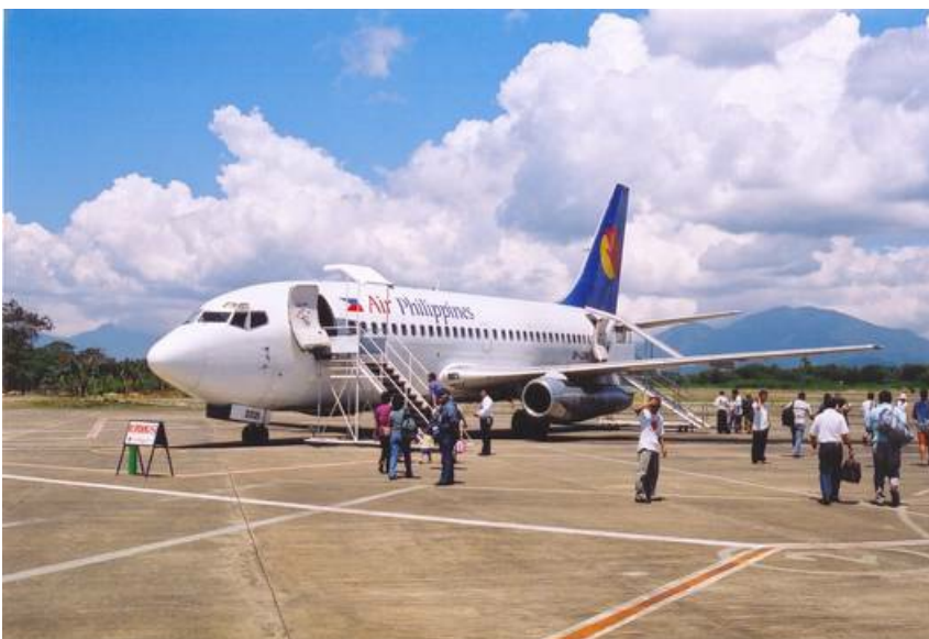
Magalhães assumed (based on copyright claims), Air Philippines B737-200, als gemeinfrei gekennzeichnet, Details auf Wikimedia Commons

Die wichtigsten Inseln des Archipelstaat Philippinen sind schnell und bequem mit dem Flugzeug zu erreichen.